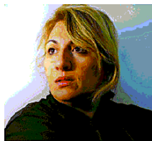
La poetessa rumena Iulia Pana

Astràgali Teatro. Da stasera al 31 agosto poker di appuntamenti a Frigole, Torre Chianca e San Cataldo realizzati in collaborazione con il Comune. La sesta edizione dell'iniziativa della compagnia salentina dedicata alla poesia è uno spazio per dare voce a molteplici esperienze di scrittura poetiche, che sono presenti sul nostro territorio, in Italia e quest'anno anche con una finestra sulla