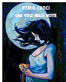
La copertina del nuovo romanzo

L'appuntamento, organizzato dall'amministrazione comunale, è alle 21 in piazza Giovanni Paolo II, nel