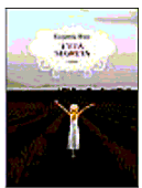
L'età segreta Eugenia Rico Elliott Pagine 220 Euro 17,00

Ti dicono che «Non può accadere, eppure accade: mettono l'etichetta del tuo sangue a un altro sangue» e ti informano che tra tre mesi morirai. L'errore però non viene scoperto subito, così la donna che ha ricevuto la diagnosi sbagliata fa in tempo a realizzare l'unica cosa che in quel momento gli sembrava sensata: mettere in liquidazione tutte le sue cose e salire in macchina senza una destinazione precisa se non quella di scoprire quale sarà la sua «età segreta», cioè il tempo che le resta da vivere.