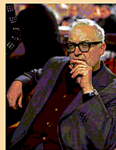
Friedrich Dürrenmatt (1921-1990). Il suo libro Il sospetto , del 1951, viene ora ripubblicato da Adelphi