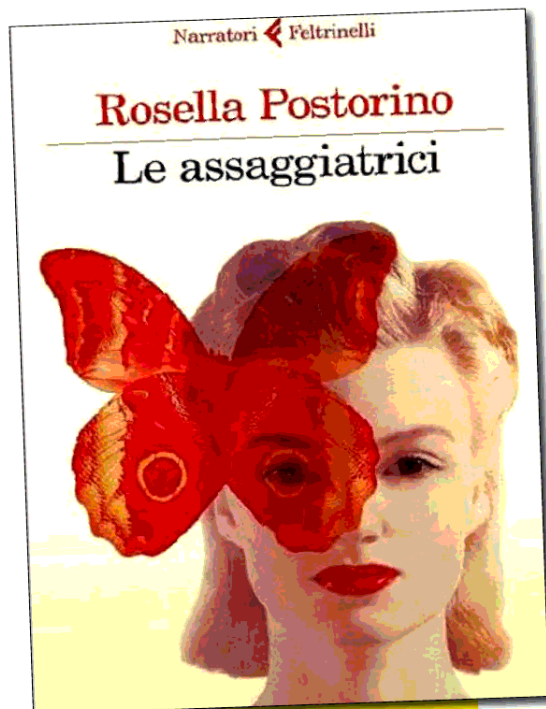
LE ASSAGGIATRICI di Rosella Postorino, Feltrinelli, € 18.

come lei, unite dal loro insolito destino, ma divise dalla paura e dalle dinamiche di potere, in un sistema in cui obbedienza significa sopravvivenza. Rosa viene anche travolta dalla passione per il temuto tenente delle SS, Ziegler. Il cibo e l'amore assumono così un significato ambivalente nel racconto. Il cibo è nutrimento, ma anche un possibile veleno; allo stesso modo, il tenente è un oppressore, ma anche oggetto di una pulsione affettiva in questa metafora sul mondo e sulla vita, che ci fa riflettere sui sensi di colpa di chi ha dovuto fare compromessi pur di sopravvivere. «Nella caserma delle assaggiatrici si rischia di morire ogni giorno, ma non più di chiunque sia vivo», dice Rosa. Di origine ligure, Rosella Postorino ha studiato Scienze cognitive e ha esordito come scrittrice a ventisei anni. Vive a Roma e si occupa di editoria. Con questo libro ha vinto il premio Campiello. ♦