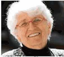
di Nicoletta Sipos